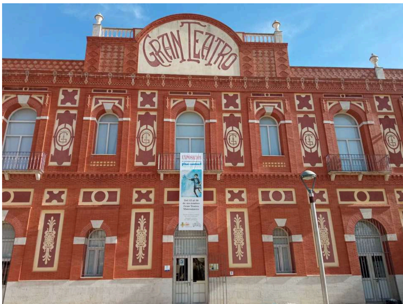
Fachada del Gran Teatro de Manzanares, última casa de la muestra

La muestra, comisariada por Román Orozco , irá acompañada de una reedición del catálogo que incluye las portadas más representativas y una selección de fotografías y dibujos, así como algunos textos rescatados de entonces y otros realizados exprefeso para la exposición.