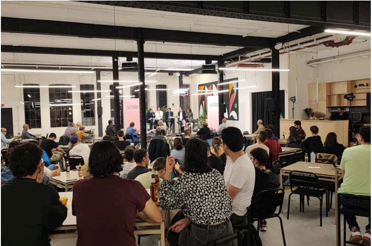
Público en la sala en la cuarta edición de La Tertulia de Larra

Tras la celebración de las cinco primeras ediciones de La Tertulia de Larra , la Fundación Diario Madrid , la Asociación de Periodistas Europeos y Ephimera preparan nuevos episodios de una serie que pretende propiciar el encuentro entre jóvenes periodistas y estudiantes con profesionales contrastados del mundo de la comunicación y los medios. El formato del encuentro es informal y se nutre de un público joven ligado al periodismo.