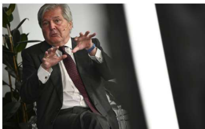
A la izq., Miguel Arias Cañete, excomisario Europeo de energía y Acción por el Cambio Climático; a la dcha., Íñigo Méndez de Vigo, exministro de Educación, Cultura y Deporte y portavoz del Gobierno