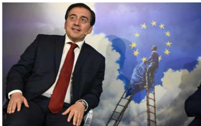
A la izq., el exvicepresidente de la Comisión Europea Joaquín Almunia; a la dcha. José Manuel Albares, ministro de Asuntos Exteriores, UE y Cooperación, en la última edición