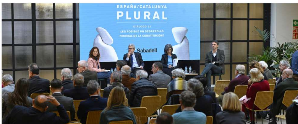
Imagen de la jornada "¿Es posible un desarrollo federal de la Constitución?" celebrada el 28 de noviembre

El ciclo seguirá contando con la colaboración del Cercle de economía de Cataluña y el Banco Sabadell.