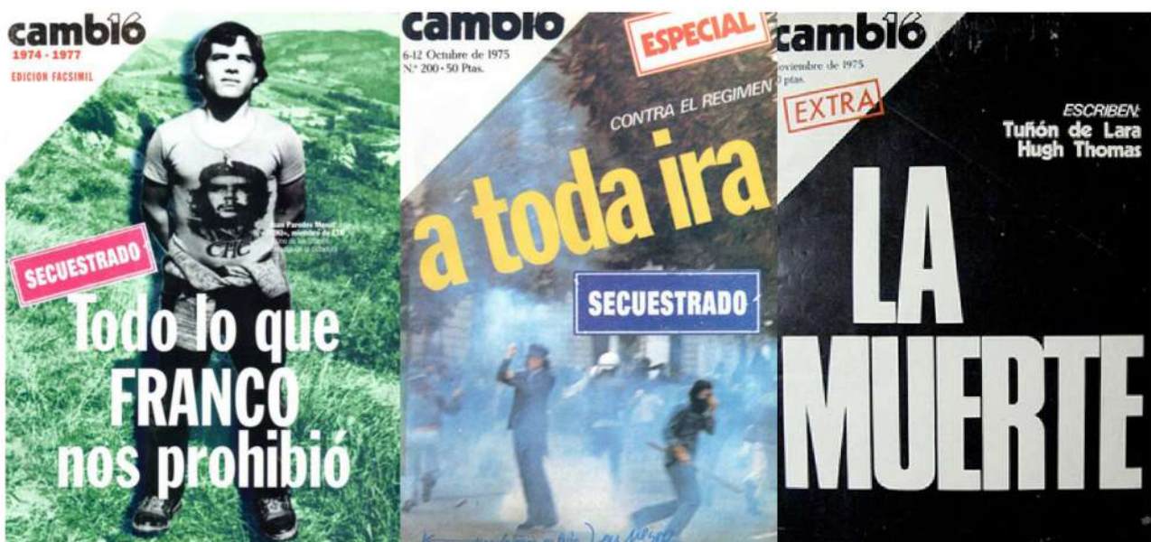
Tres icónicas portadas del semanario

Unido al proyecto anterior, la FDM realizará la digitalización de los cinco años del semanario (1971-1976) que aún no están disponibles en formato digital.