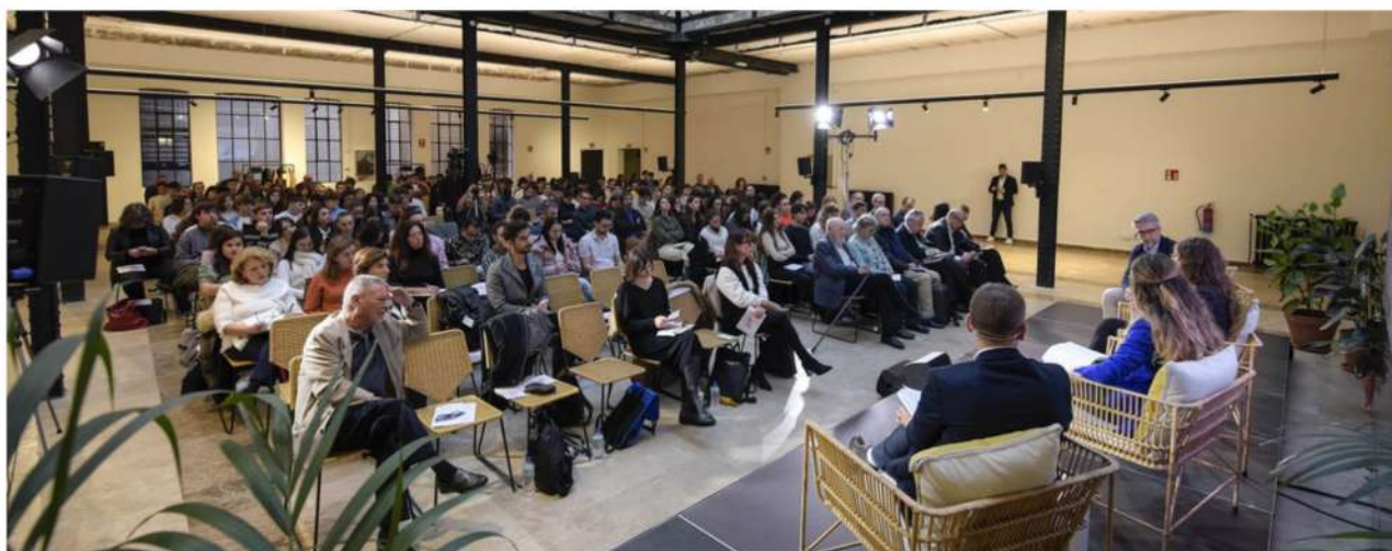
Salón de actos con más de 300 personas acreditadas en la XX Jornada Nacional de Periodismo celebrada en noviembre

La Fundación del Diario Madrid colaborará con la Asociación de Periodistas Europeos en la celebración de la XXI Jornada Nacional de Periodismo que tendrá lugar en su sede de Larra en el mes de octubre de 2024. Se trata de una serie iniciada en 2003 y que ha reunido a varios centenares de periodistas de toda procedencia geográfica con el propósito de analizar los retos, desafíos y amenazas de una profesión imprescindible para la salud democrática. Desde entonces se han celebrado veinte ediciones que siempre han sido clausuradas por una personalidad del gobierno o de las instituciones.