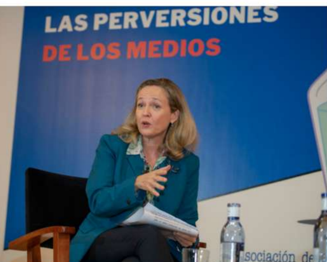
Nadia Calviño, Vicepresidenta primera del Gobierno y ministra de Economía, en la clausura de la XVIII Jornada