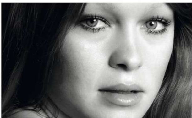
La actriz Marisol y el Che Guevara en la Ciudad Universitaria de Madrid, dos fotografías icónicas de César Lucas

César Lucas, de formación autodidacta, se inició con tan solo diecisiete años como fotógrafo de la agencia Europa Press. Más adelante pasa por el diario Pueblo como redactor gráfico, y en 1965 funda Cosmo Press, su propia agencia gráfica. El trabajo de este abulense es de referencia obligada como uno de los más grandes fotoperiodistas y editores gráficos de nuestro tiempo. César Lucas combinó su trabajo en prensa con varios encargos para las compañías cinematográficas que rodaban superproducciones de grandes películas en nuestro país por aquella época —finales de la década de los 60, principios de los 70—. Por su objetivo pasaron estrellas de la talla de Katharine Hepburn, Brigitte Bardot, Sean Connery, Raquel Welch, Yul Brinner, Romy Schneider, John Lennon, Billy Wilder, Clint Eastwood, Stephen Boyd y Buster Keaton.