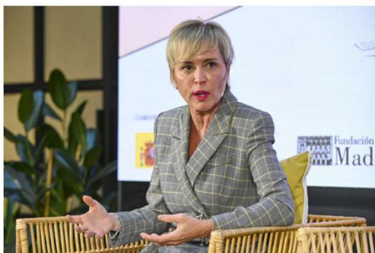
Carme Artigas, Secretaria de Estado de Digitalización e Inteligencia Artificial, en la última edición