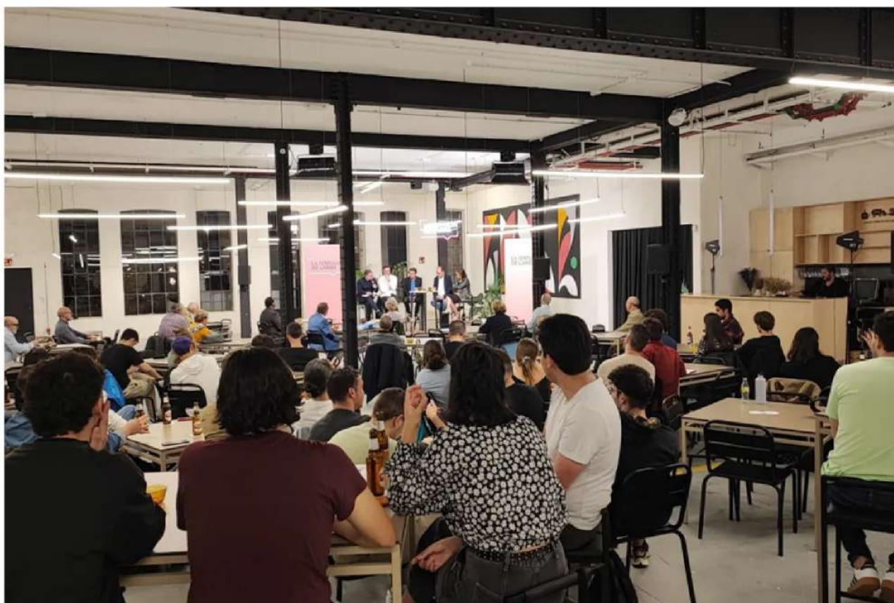
Público en la sala en la cuarta edición de La Tertulia de Larra

Tras la celebración de las primeras cinco ediciones de La Tertulia de Larra, la Fundación Diario Madrid, la Asociación de Periodistas Europeos y Ephimera preparan nuevos episodios de una serie que pretende propiciar el encuentro entre jóvenes periodistas y estudiantes con profesionales contrastados del mundo de la comunicación y los medios. El formato del encuentro es informal y se nutre de un público joven ligado al periodismo.