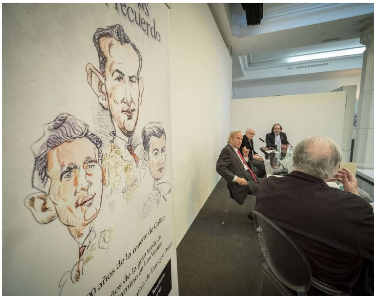
Cartel de la novena edición durante la celebración de los coloquios

Durante el mes de mayo de 2024, y coincidiendo con la Feria de San Isidro, se dará continuidad al ciclo taurino.