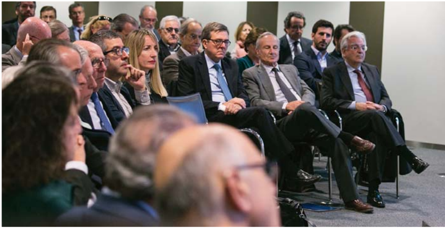
Algunos asistentes al 17 diálogo «España plural / Catalunya plural»