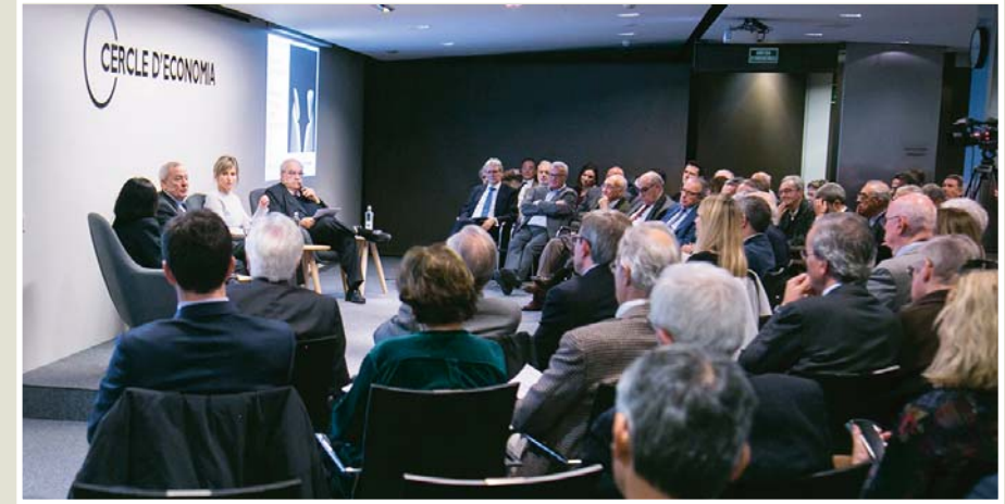
Salón de actos del Cercle d'Economia de Barcelona durante el 17 diálogo «España plural / Catalunya plural»